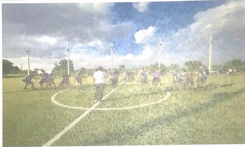
การแข่งขันกีฬาชักกะเย่อ